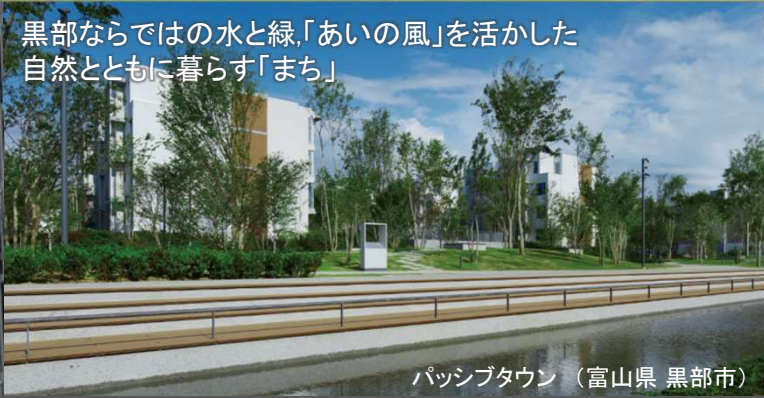
黒部ならではの水と緑、「あいの風」を活かした自然とともに暮らす「まち」