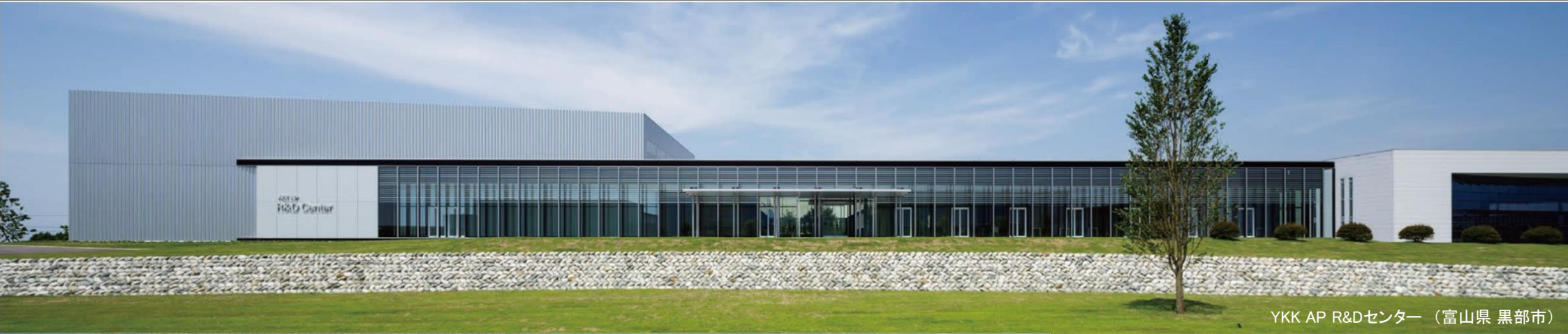
YKK AP R&Dセンター（富山県 黒部市）